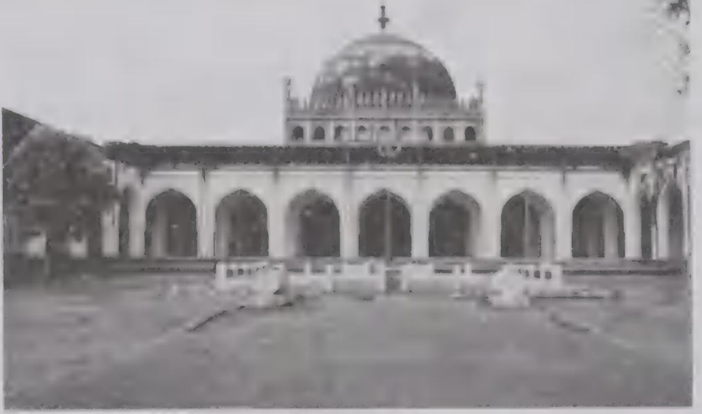
ಜಾಮಿ ಮಸೀದಿ ಕಟ್ಟಡ, ಬಿಜಾಪುರ

ಬೀಬಿಯ ಕಾಲಕ್ಕೆ ಮತ್ತು ಇಬ್ರಾಹಿಮನ ಕಾಲಕ್ಕೆ ನಿಕಟವಾದವು. ವಿಶ್ವವಿಖ್ಯಾತ ಗೋಲ್‌ಗುಮ್ಮಟವನ್ನು ಇಬ್ರಾಹಿಮನ ಮಗ ಮುಹಮ್ಮದನು ಕಟ್ಟಿಸಿದ.